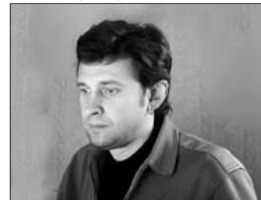
ПОЛОСУ ПОДГОТОВИЛ АЛЕКСЕЙ БИРЮКОВ

щий день пермяки взяли реванш. Сценарий игры походил на захватывающий триллер. Первую партию выиграли хозяева (25:19), но затем восстановилось статус-кво (25:23). «Аборигены» в третьем сете еще раз вышли вперед (25:22), визитеры опять их догнали (25:20). И в решающем раунде, на тай-брейке удача улыбнулась гастролерам – 15:8.